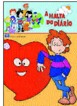
Malta do DIÁRIO assinala Dia Mundial da Saúde