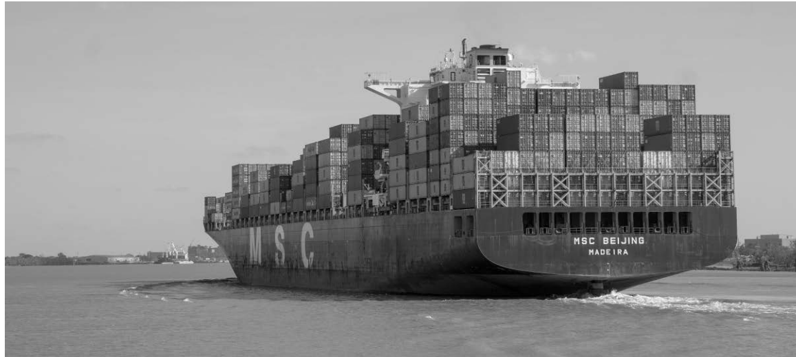
Em termos de arqueação bruta, o RIN-MAR cresceu 1.900% em 20 anos.

frota mundial continua a ser positiva naquilo que respeita à tonelagem, a bandeira portuguesa continua a ser uma das que revela maior taxa de crescimento a nível global sendo que os dados mais recentes mostram que 80% da tonelagem que atrai resulta de novos navios e de navios que regressam à Europa, vindos de bandeiras offshore.