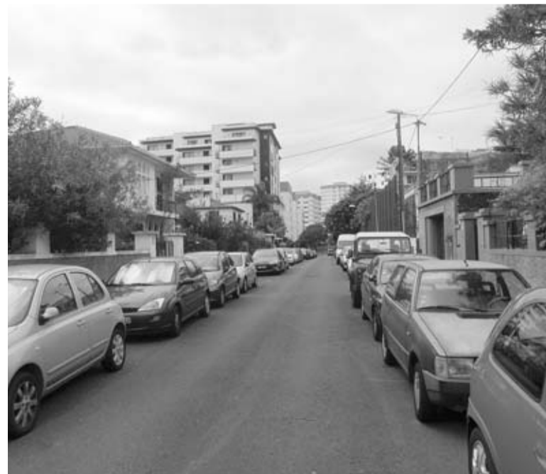
Uma pastelaria da Rua Tenente Coronel Sarmento foi assaltada.

O assalto é estranho na medida em que não há indícios de arrombamento, presumindo-se que o suspeito usou uma chave falsa para cometer o furto. R.D.F.