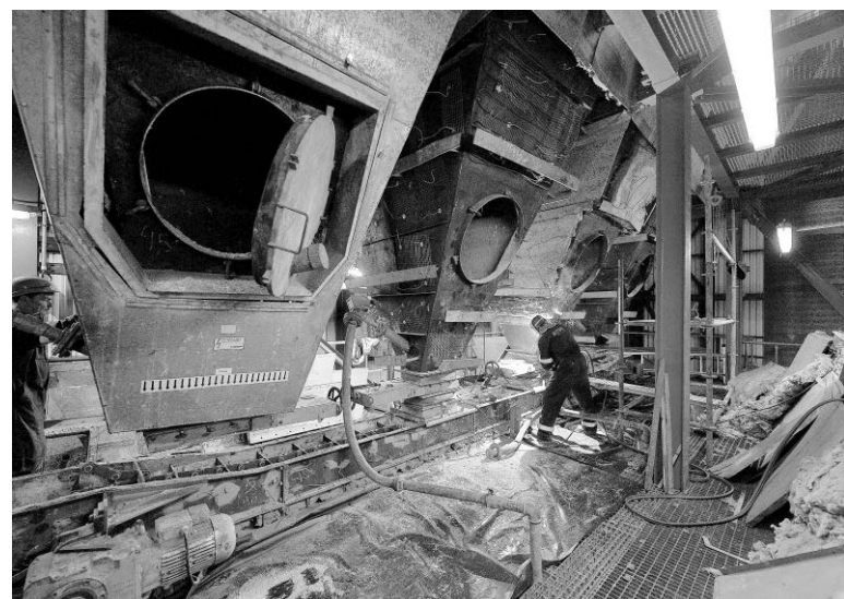
Trabalhos de manutenção chegam a todos os componentes.

Em média, a incineração garante a redução em 80%, tanto em peso, como em volume, dos resíduos, sendo, no entender daquele responsável, "a forma mais eficaz para gestão dos resíduos urbanos", cumprindo com todos os requisitos ambientais e de saúde pública.