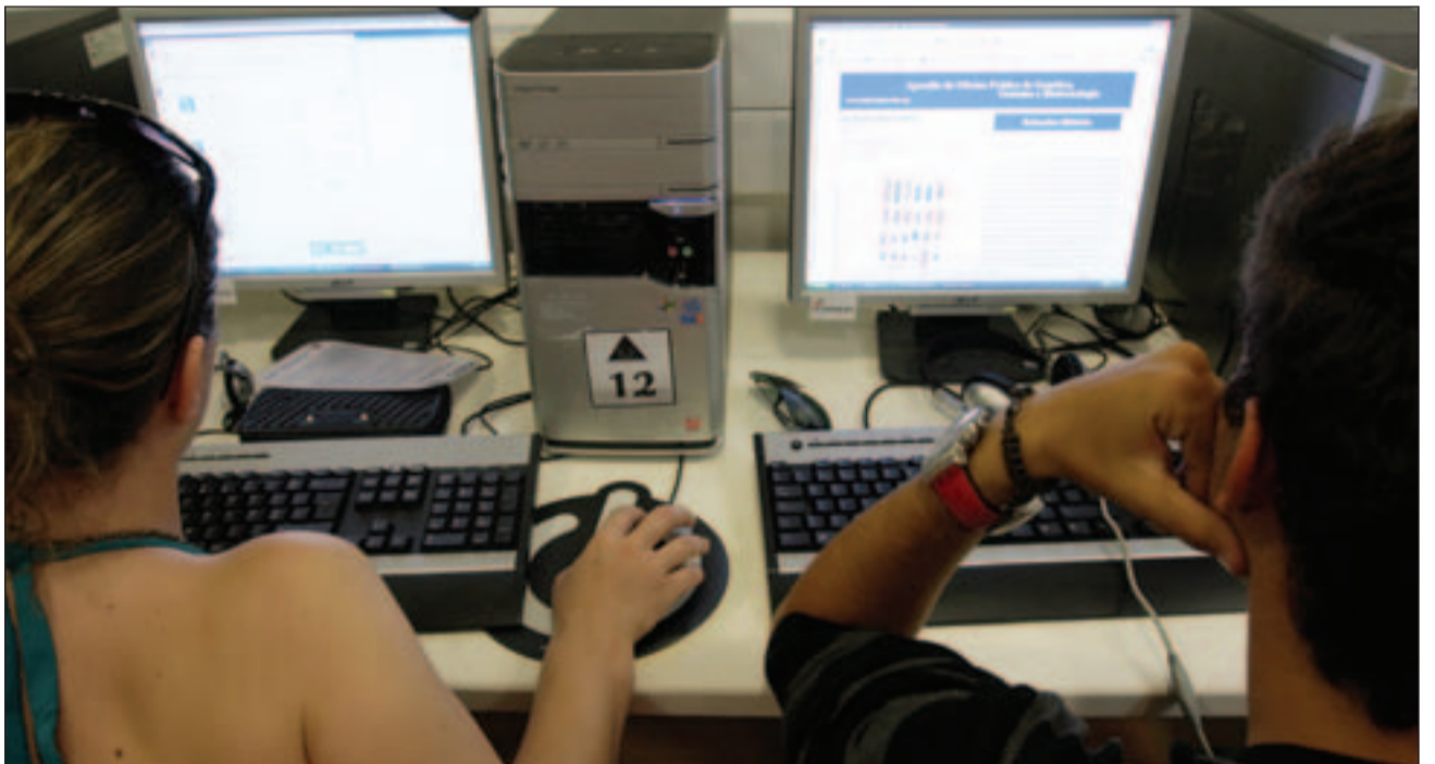
Os estabelecimentos que disponibilizam visitas ao ciberespaço estão quase sempre cheios.