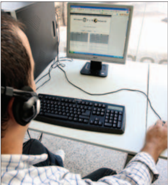
Alguns utilizadores destes espaços não têm internet em casa.