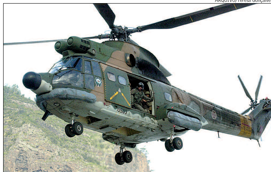
O helicóptero "PUMA" da FAP participou nas buscas para tentar encontrar o avião desaparecido.

Além dos meios oficiais da Armada e da Força Aérea, duas lanchas particulares entraram em acção