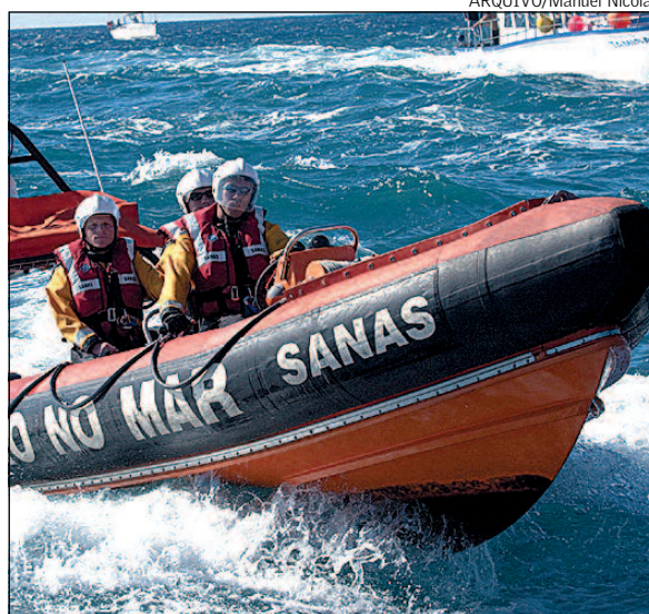
O SANAS fez deslocar para o local, com grande prontidão, três Tornados e quinze homens.

Todos os meios de salvamento e busca disponíveis na Região, sobretudo aéreos e náuticos, foram postos em acção para tentar encontrar o bimotor de registo norte-americano, mal a Protecção Civil despoletou o alarme, tendo também colocado os bombeiros de Machico em estado de prevenção.