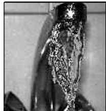
ESCOLA DEBATE "BEM ESSENCIAL QUE SE ESGOTA."