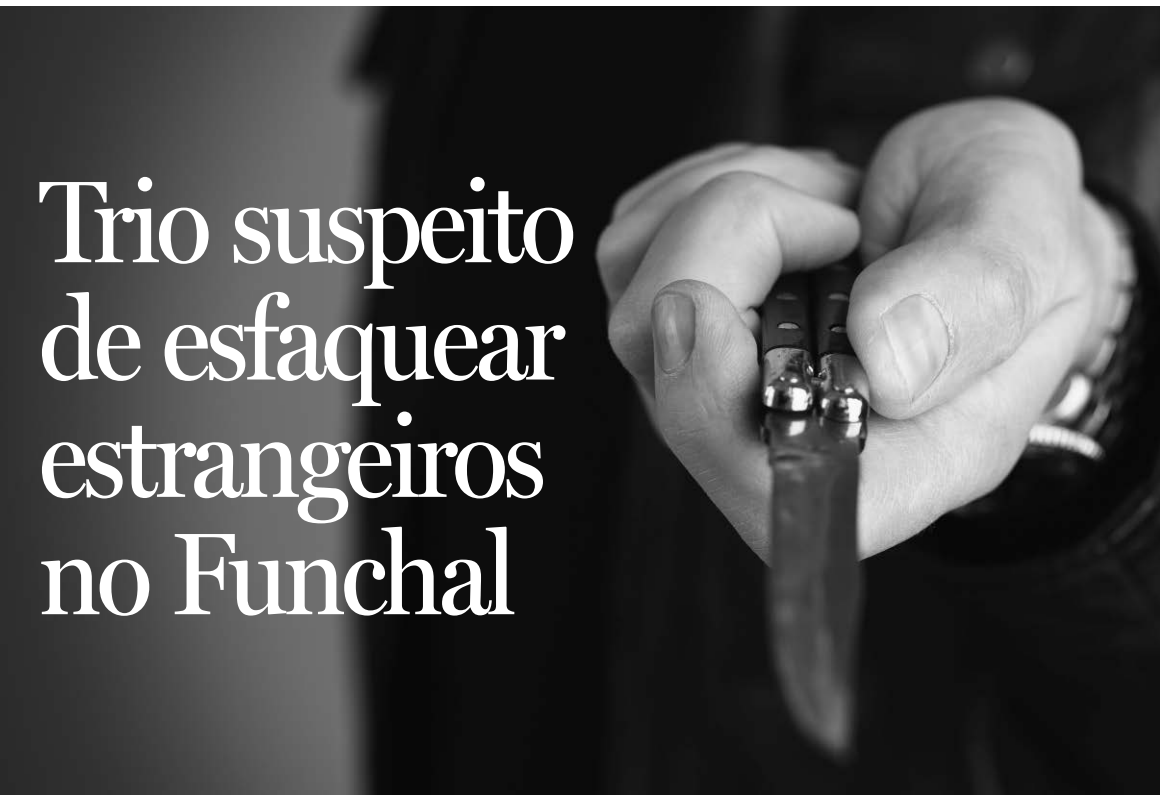
Três cidadãos estrangeiros foram ontem agredidos no Funchal.

ANDREÍNA FERREIRA afferreira@dnoticias.pt