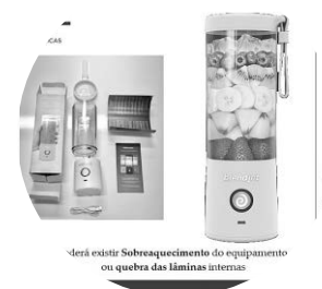
«Não existe sobreaquecimento do equipamento ou quebra das lâminas internas»

Dois homens estrangeiros, de 24 e 26 anos, foram agredidos na madrugada de ontem, no Funchal, na Travessa do Rego. As vítimas foram atingidas com um pau, por volta das 2 horas, e sofreram diversos ferimentos. Ambos foram assistidos pelos Bombeiros Voluntários Madeirenses e transportados para o hospital. O que inspirava mais cuidados apresentava um golpe na cabeça.