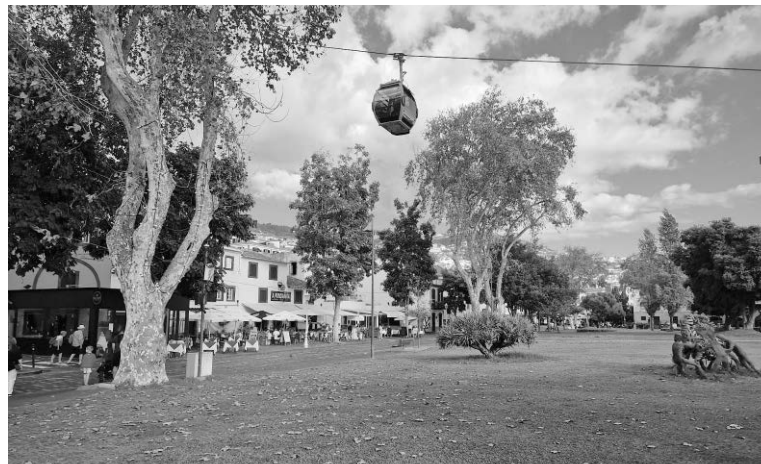
A detenção foi feita junto ao jardim do Almirante Reis.

A PSP informou ainda que esta é a sétima vez que o mesmo suspeito é detido pelo mesmo tipo de crime, no mesmo local, "estando inclusivamente sujeito a medidas de coacção de apresentações periódicas no Comando Regional da PSP Madeira e proibição de frequentar espaços conotados com o tráfico e consumo de estupefacientes".