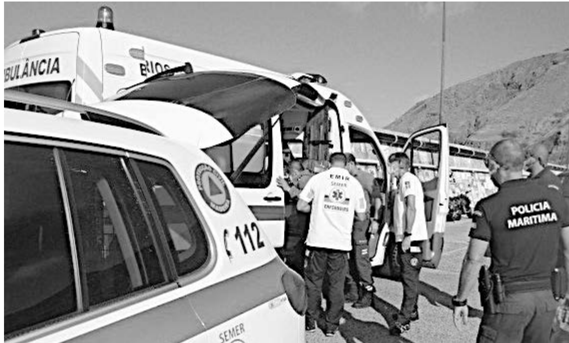
EMIR e bombeiros aguardaram, na Marina do Porto Santo, chegada da vítima evacuada por via marítima