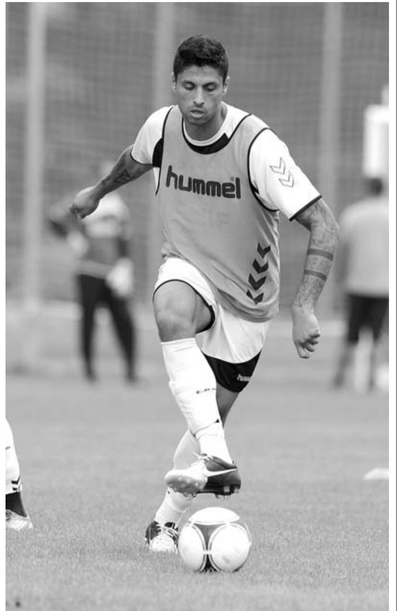
O internacional português estará afastado dos treinos da equipa.