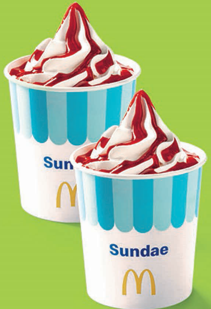
Imagens ilustrativas.