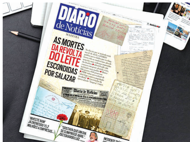
Um trabalho de investigação do jornalista Élvio Passos, publicado na edição de 25 de Abril de 2022, traz à luz aspectos até então desconhecidos da Revolta do Leite, de 1936, como a existência da única vala comum conhecida em território português, no Cemitério das Angústias, no Funchal.

“Na altura a produção de lacticínios era uma das maiores produções da ilha, com muita gente do povo que possuía cabeças de gado leiteiro que vendiam ►