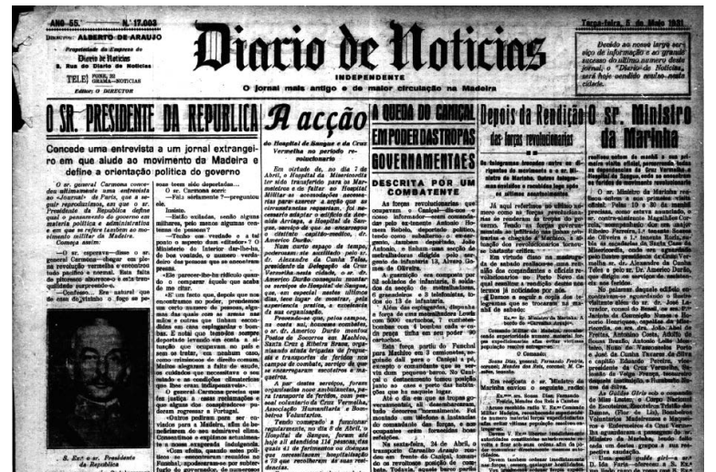
A 5 de Maio de 1931 o DIÁRIO relata “a queda do Caniçal em poder das tropas governantes”, descrita por um combatente.

“Uma revolta da arraia-miúda, sem figuras de proa dos partidos da I República, de pessoas gradadas da Maçonaria ou de altos postos mili-