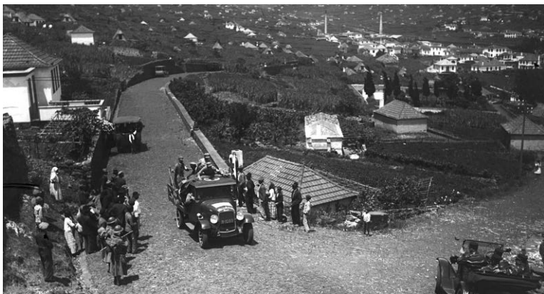
Carro da Cruz Vermelha, em Machico, a transportar feridos para o Funchal | Abril de 1931.

▶ às várias indústrias. Ora a concentração num monopólio iria baixar drasticamente o preço, já de si muito baixo e quase de sobrevivência”, elucida o historiador.