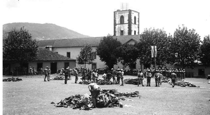
Armamento abandonado pelos revoltosos no Quartel do Colégio (Funchal) | Maio de 1931. FOTO PERESTRELLOS PHOTOGRAPHS | EM DEPÓSITO NO ABM

Museu de Fotografia da Madeira - Atelier Vicente's