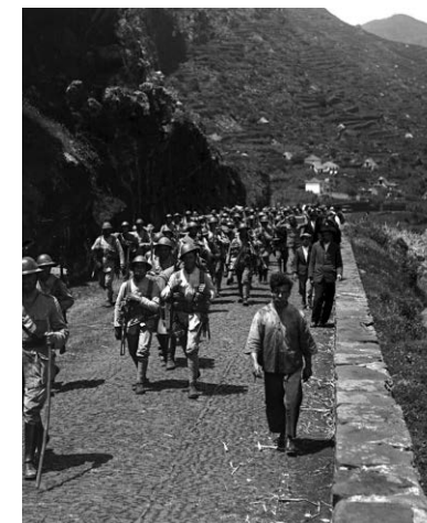
Tropas governamentais vindas de Machico, a caminho de Santa Cruz | Maio de 1931.