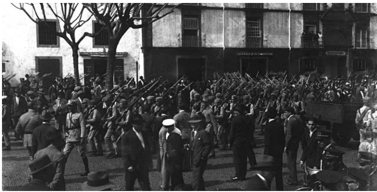
Militares na avenida Dr. Manuel Arriaga (actual Avenida Arriaga) durante a Revolta da Madeira, freguesia da Sé, concelho do Funchal | 4 de Abril de 1931.