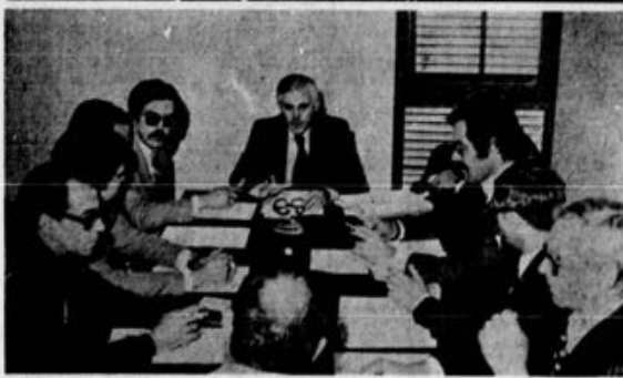
Destas emman saíram os primeiros passos para uma definição correcta do que deve ser a participação das Regiões Autónomas nas provas do âmbito regional. A problemática dos transportes e o suporte financeiro foi o tema equivo.