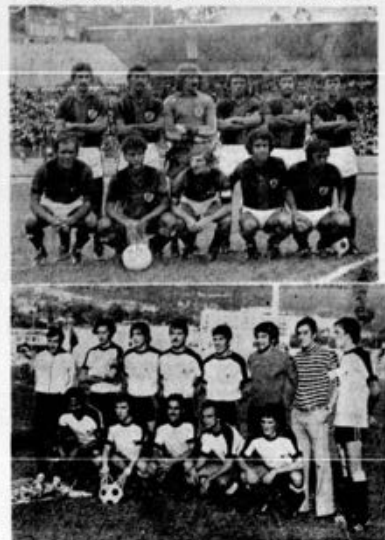
FINALISTAS: Marítimo e Nacional vão discutir, logo à noite, a condição de vencedor do Torneio Internacional «Vitorino Nemésio», a primeira prova a reunir representantes dos arquipélagos atlânticos — Canárias, Açores e Madeira. Bom jogo em perspectiva, em que a emoção vai ser a srinha da festa, como de tantas, tantas vezes.

se poderá falar, propriamente, de fracasso, de indiferença do público madeirense. Da nossa parte, consideramos até que foi ao Estádio o número de pessoas que, até à jornada justificada. Não houve evidência pública-organização e estamos em crer que o número de assistentes difere, por defeito, do montante de bilhetes de ingresso vendidos.