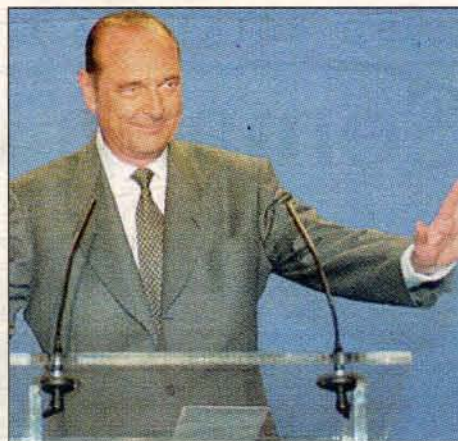
Jacques Chirac é o novo Presidente da França