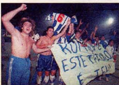
O Porto é campeão.

O fim-de-semana futebolístico trouxe poucas alegrias aos madeirenses. Na fuga à despromoção da I Divisão, o União não foi feliz em Braga, onde perdeu por 2-0, complicando ainda mais este dramático final de campeonato. Na luta por um lugar na UEFA, o Marítimo cumpriu a sua parte, mas viu Farense e U. Leiria obterem