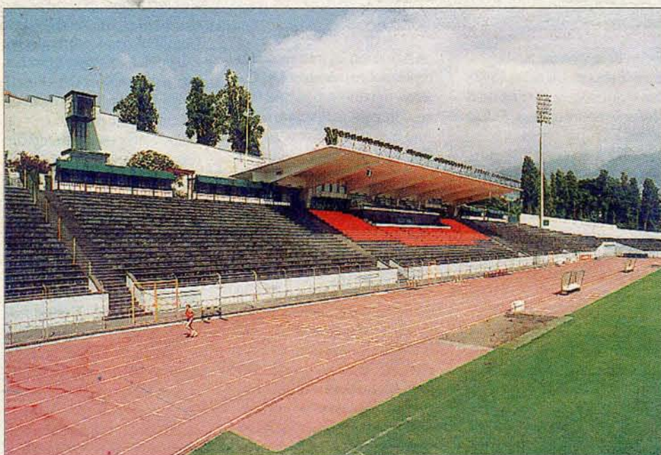
O Governo Regional quer ver os Barreiros a ombrear com a Luz, Antas ou Alvalade.