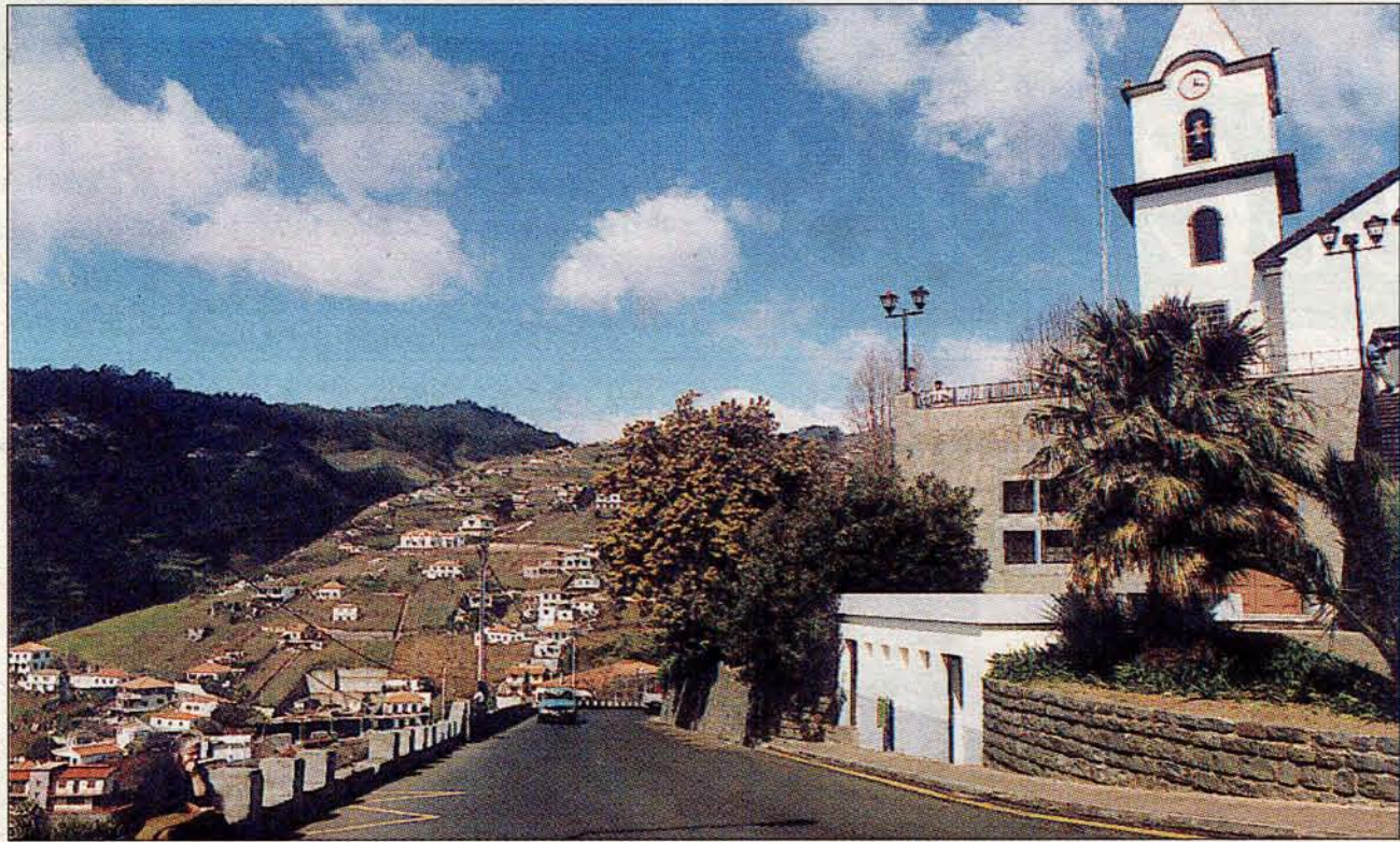
Estreito de Câmara de Lobos: a Europa em debate.