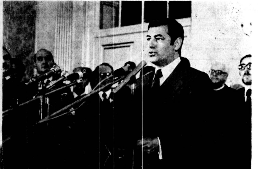
Coronel Lino Miguel, ministro da República para a Região Autónoma da Madeira, quando proferia o seu discurso.