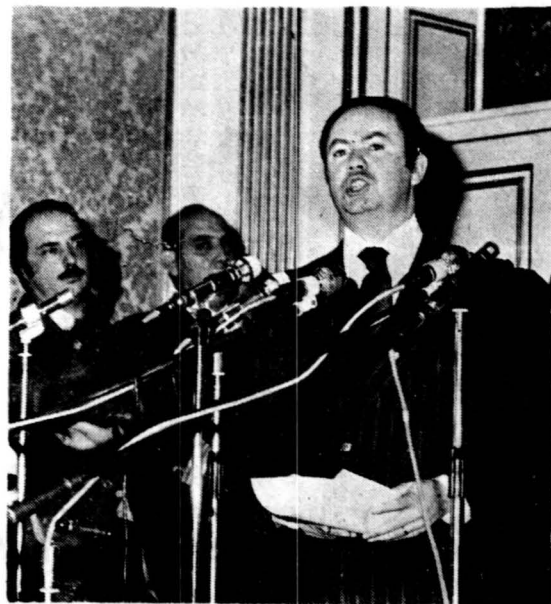
O dr. Alberto João Jardim, presidente do Governo Regional, usando da palavra no acto de posse.

Hoje, já não há lugar à primazia de debates ideológicos, das confrontações ideológicas ou dos meros ensaios discursivos. Para a maioria dos cidadãos as grandes opções de valor estão feitas. O que urge, agora, é concretizar ideias, desenvolver opções, fazer coisas. Só assim é que se poderá demonstrar a correcção ou a incorrecção das opções de valor que cada um, a seu tempo, julgou as melhores. Portugal não é um País desvol-