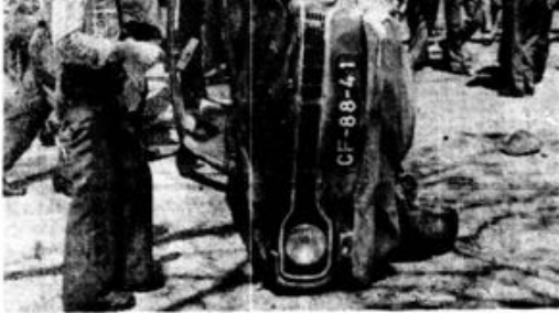
Ficou muito danificado o automóvel que veio a colhar o homem que transportava um cacho de bananas e que foi levado para o Hospital em estado de choque.