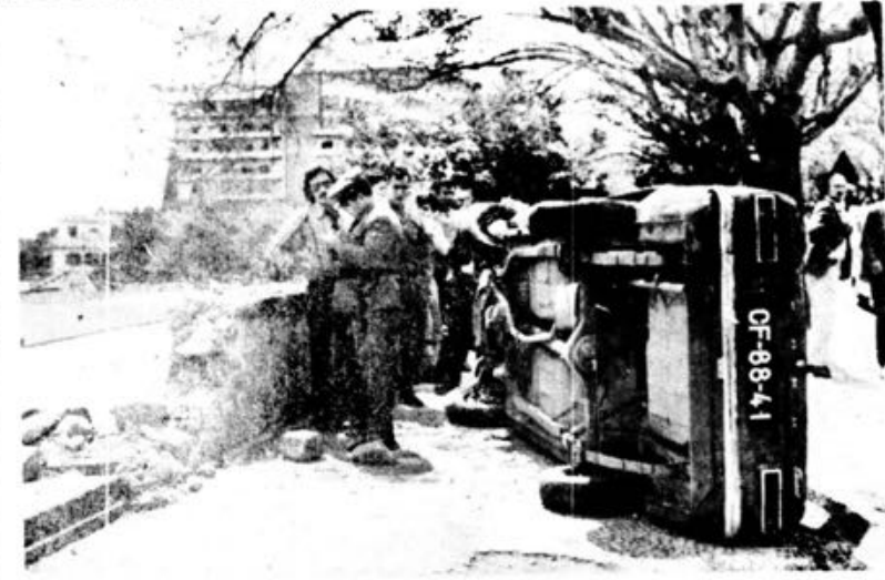
No passeio sul da Avenida do Infante (parte plana), a nossa Reportagem captou esta imagem, após o aparatoso acidente.

O sinistrado, que sofreu contusão na perna e pé direitos, foi atendido na Cruz Vermelha, dali transitando para o Hospital dos Marmeleiros.