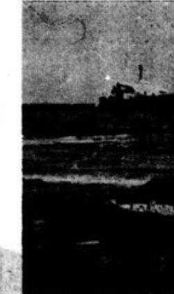
O «Cernoo» visto da terra

O teor da mensagem do Professor Marcello Caetano será dentro de dias dado conhecimento ao Senado Universitário, que reunirá expressamente para o efeito.