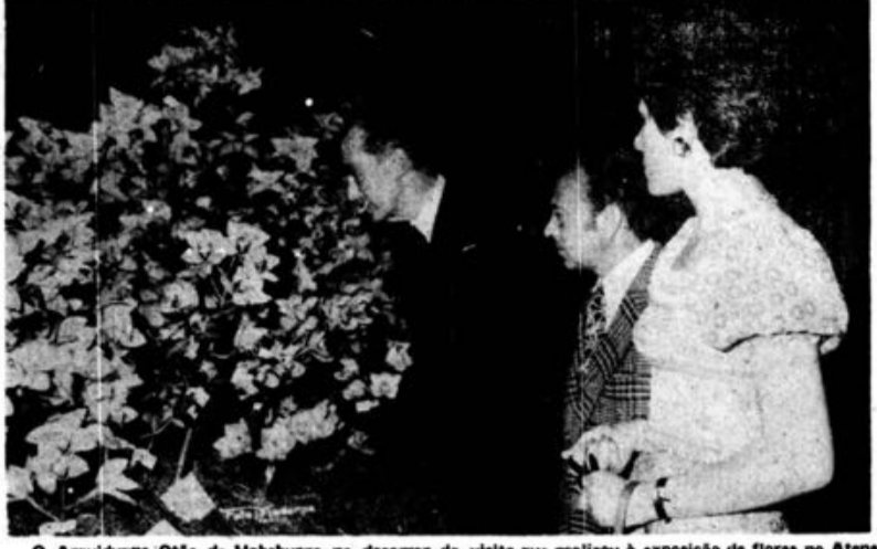
O Arquiduque Otão de Habsburgo no decorrer da visita que realizou à exposição de flores no Ateneu Comercial do Funchal.

WASHINGTON, 23.— Quatro congressistas republicanos solicitaram ao Congresso a normalização das relações diplomáticas com Cuba abolido certas leis que proíbem o comércio com aquela nação. A proposta foi apresentada pelo representante Charles Whelan, republicano do Ohio, co-patrocinado pelos representantes republicanos Joel Pritchard, Washington, Alphonso Bell, Califórnia, e Paul McCloskey, também da Califórnia.