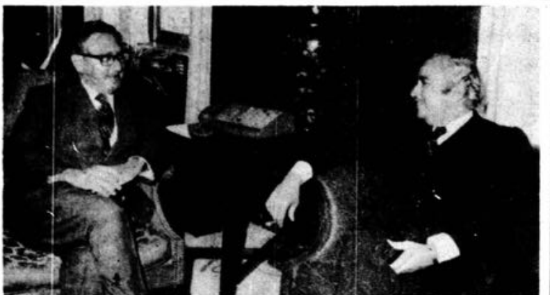
O secretário de Estado norte-americano, Henry Kissinger e Ismail Fahmy, ministro dos Negócios Estrangeiros egípcio, no decorrer das conversações sobre a situação no Médio-Oriente.

por cento dos casos, incluindo os mais graves, sobretudo conseguiu-se prevenir a complicação mais perigosa do reumatismo. (Continua na 4.ª página)