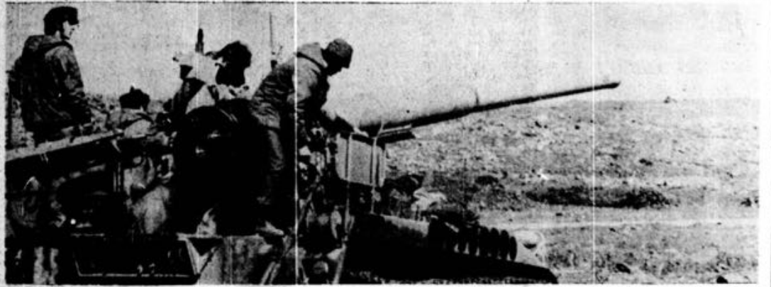
Tropas israelitas preparam a sua arma de 175 milímetros, de fabrico americano, durante um alerta nos Montes Golá. A tensão continua na frente síria.

QUANDO O BELO ESPECTÁCULO DA NEVE se transforma em tragédia Ler notícia na 5.ª página