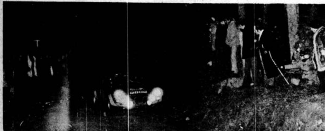
Raffaele Pinto numa das florestas