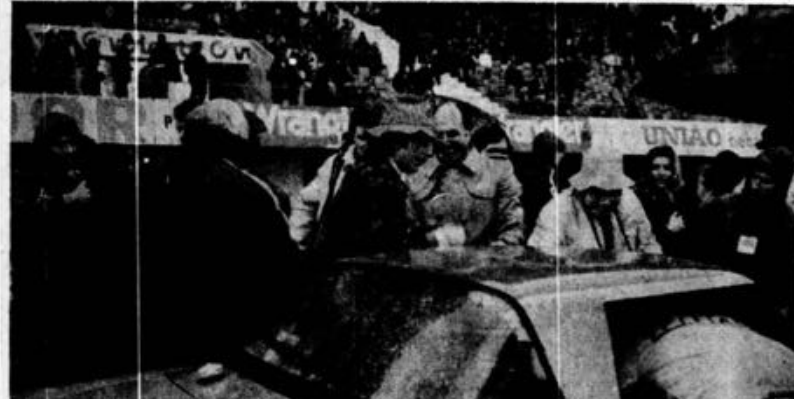
Alcide Paganelli trocando impressões com um dirigente da «Fiat» antes de iniciar a prova de estalomo.

leida que lhe permitiu simultaneamente evidência individual e para a marca que com