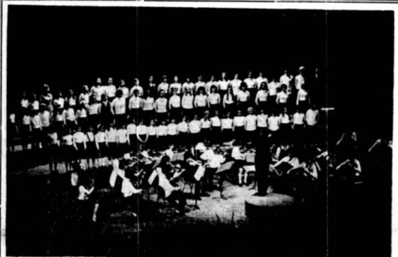
Academia de Música de Santa Cecília de Lisboa. Orquestra de Arco acompanhando o Coro

Em viagem de rotina, a bordo do navio-patrulha «Boavista», da Armada Portuguesa.