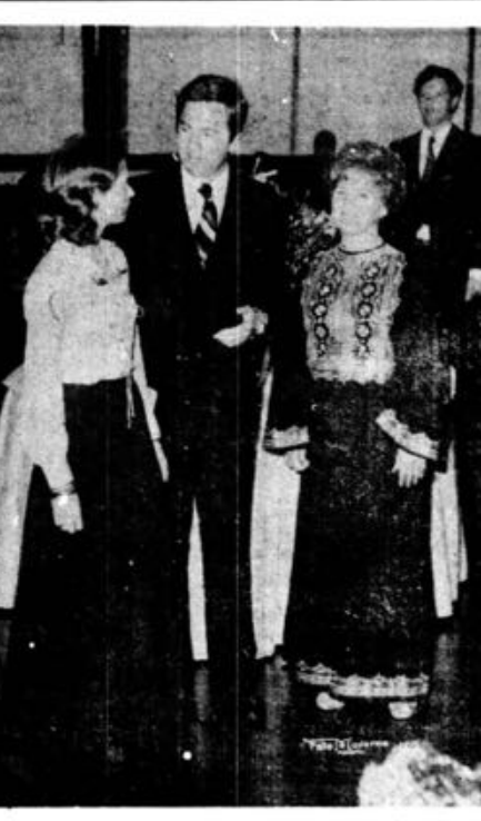
O sr. Forster no momento em que usava da palavra