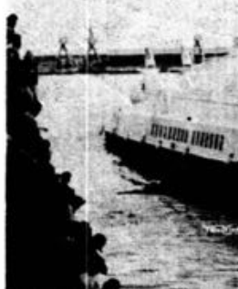
O «Pirata Azul» nas manobras de atracagem ao cais do Funchal

A sua chegada ao porto do Funchal, o «Pirata Azul», que, atracou, primeiramente, ao cais da entrada da cidade, foi alvo da curiosidade de grande número de pessoas.