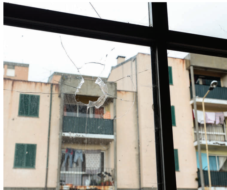
Moradores temem pela própria segurança e anseiam intervenção por parte do Governo Regional.