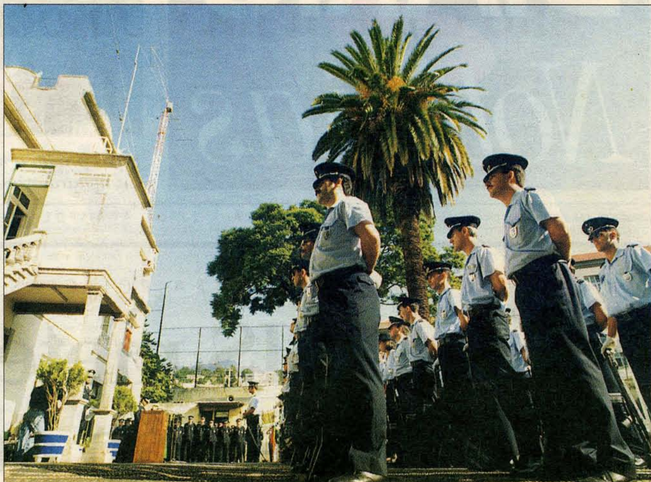
O Forum Justiça e Liberdade afirma que a nova missão dos agentes de Segurança Pública "viola as competências da PSP".