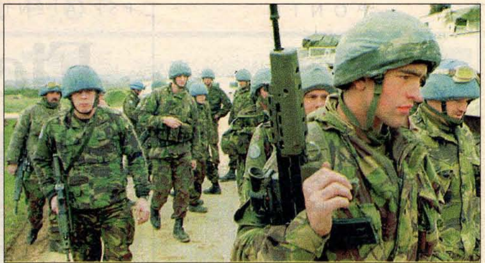
NATO pronta a intervir em Gorazde diz aguardar ordens de Bill Clinton