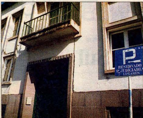
Fichas elaboradas pela PSP vão direitas para a PJ.

PSP ATENTA AOS SINAIS ESTRANHOS DE RIQUEZA